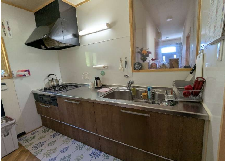
システムキッチン